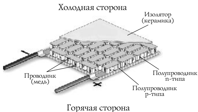
Рисунок 3. Термобатарея.

В термоэлектрическом генераторе для получения электричества используется эффект Зеебека, который заключается в появлении электродвижущей силы в замкнутой цепи из двух разнородных материалов, если места контактов поддерживаются при разных температурах.